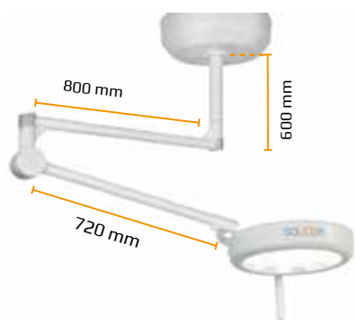
Soporte de techo (En configuración individual o doble)

SOLED15 está disponible en las siguientes versiones