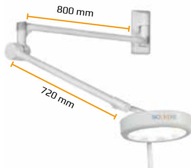
Soporte de pared